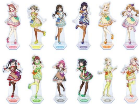
▲ビッグアクリルスタンド (ニジガク Let'sにじパフェ!) (全12種)