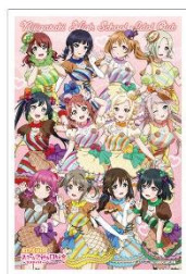
▲通期共通 限定クリアプロマイド 2023年6月24日(土)～8月27日(日)

お土産屋にて商品のお会計2,000円(税込)ごとに限定クリアプロマイドを1枚プレゼントいたします。