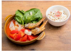
▲創作料理チームイチオシ！ 焼き手羽先 & チーズのトマト鍋