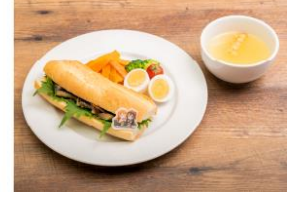
▲彼方からしずくへ 焼きサバ和風サンドイッチ