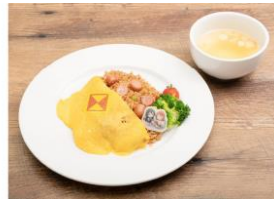
▲歩夢からせつ菜へ ウィナーとパプリカのジャンバラヤ