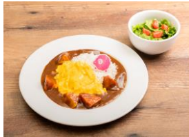
▲近江家のおうちカレー