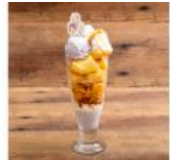
▲グローバル交流チームの マンゴーパフェ