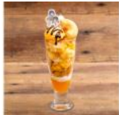
▲衣装&グッズ考案チームの チョコ&オレンジパフェ