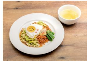
▲愛からミアへ もんじゃ風あんかけ焼きそば