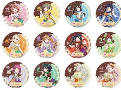
▲第1弾 オリジナルコースター/全12種・ランダム

ドリンク・フード・パフェメニューを1品ご注文につきいずれかのオリジナルコースターが1枚もらえます。