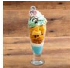
▲IT活用チームの チョコミントパフェ