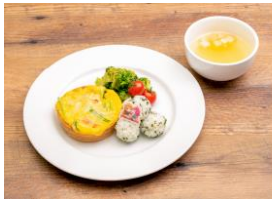
▲彼方から璃奈へ すくすく成長キッシュプレート