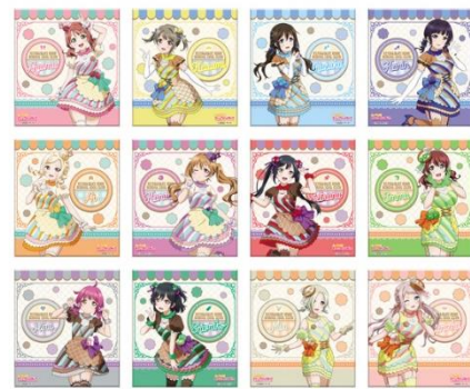
▲アートパネル (ニジガク Let'sにじパフェ!) (全12種・ランダム)