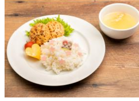
▲歩夢からかすみへ 豆腐ハンバーグプレート