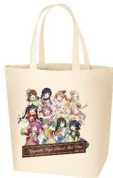
▲トートバッグ(ニジガク Let's にじパフェ!) (全1種) 【サイズ】H約400mm×W約330mm×D約150mm