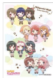
▲第1弾 限定クリアプロマイド 2023年6月24日(土)～7月14日(金)