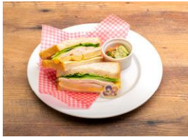
▲彼方から果林へ 糖質オフサンドイッチ